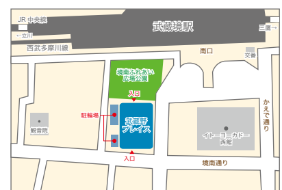
武蔵境駅南口 徒歩1分

休館日 水曜日、第3金曜日（第3金曜日の属する週の水曜日は開館） 年末年始、図書特別整理日