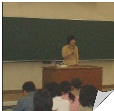
五大学共同教養講座（東京女子大学にて）

今後この五大学共同教養講座は、日本獣医畜産大学「動物との共生」→武蔵野大学「健やかなシルバーライフのために」→成蹊大学「現代企業社会と会社法」→亜細亜大学「中国を問い直す」と続き、最終回の12月には修了式が行われる。123名の聴講生の皆さんが、楽しく有意義な時間を過ごされることを期待します。