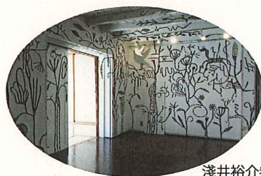
浅井裕介参考作品