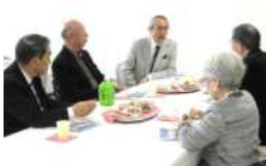
懇談会は、講座の情報交換などで盛り上がり、和気藹々とした集いになりました。