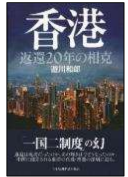
『香港-返還 20 年の相克-』

この度、香港の中国返還 20 年を題材に研究成果を上梓しました。といっても堅苦しい本ではありません。写真や年表を入れ、エピソードやストーリーで読めるよう工夫しました。香港を通して見える中国の姿は、初めての方にもわかりやすい点が多く、心地よい読後感を提供できるのではないかと思います。ぜひ感想も聞かせてください。」 遊川 和郎(亜細亜大学アジア研究所 教授)