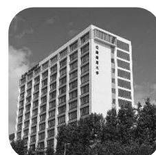
11月 亜細亜大学 【オンライン】