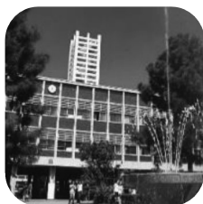
6月 武蔵野大学 (対面)

平成9年度から開催している武蔵野地域五大学共同教養講座は、武蔵野地域五大学（亜細亜、成蹊、東京女子、日本獣医生命科学、武蔵野）で各4回、全20回にわたって行われる連続講座です。各大学の特色あるテーマで構成され、幅広く学ぶことができる人気の講座です。ご応募お待ちしております！（ 特定の大学のみの申込みはできません ）