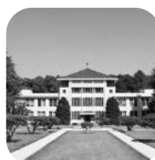
10月 東京女子大学 【オンライン】