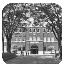
9月 成蹊大学 (対面)