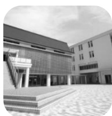
7月 日本獣医 生命科学大学 (対面)